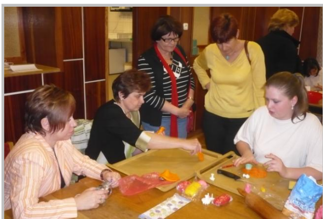
Akce pro ženy v Čelechovicích na Hané