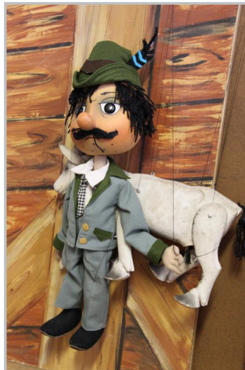
Projekt realizovaný s podporou LEADER – loutkové Divadlo v Olšanech u Prostějova