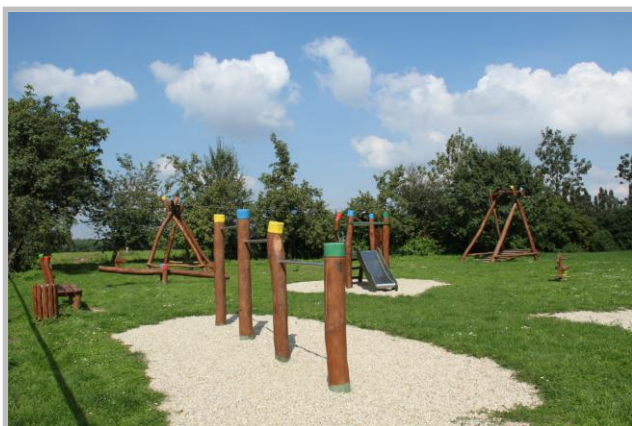
Projekt realizovaný s podporou LEADER – dětské hřiště v Olbramicích