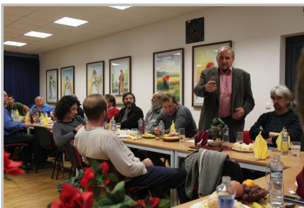
Valná hromada v Čechách pod Kosířem - 2010